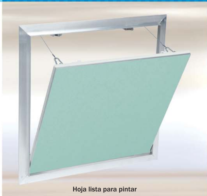
Hoja lista para pintar

Sistema F2 - Marco de aluminio, con o sin placa de yeso laminado hidrófuga, para techos y paredes