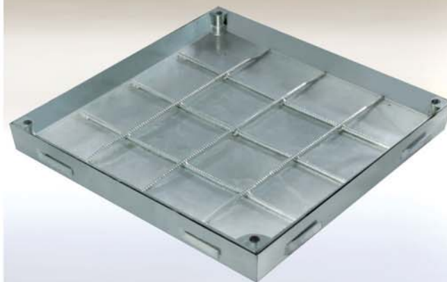
Acero galvanizado al calor / Acero inoxidable