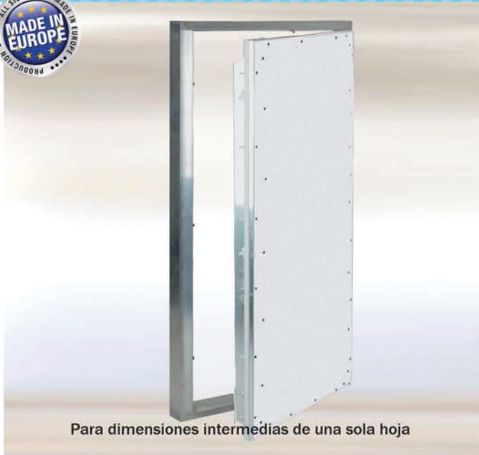
Para dimensiones intermedias de una sola hoja