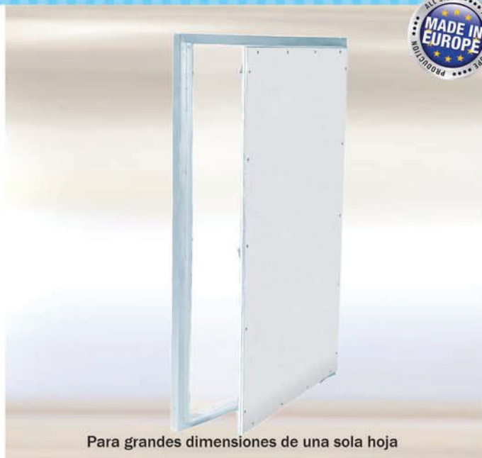
Para grandes dimensiones de una sola hoja

La puerta de 12,5 mm se puede adaptar a paredes de placa de yeso laminado hasta un espesor de 25 mm. También se pueden utilizar sobre muros de concreto.